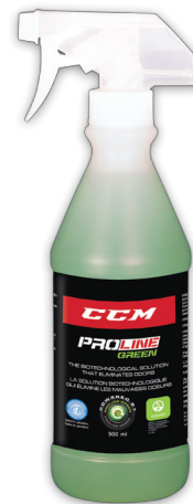
500 ML No d'article 10052