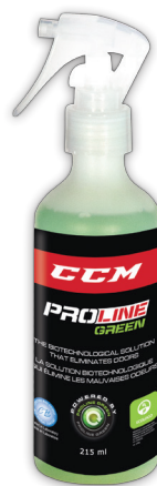
215 ML No d'article 10051