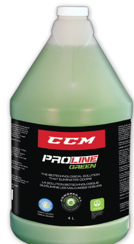
4 L No d'article 10053